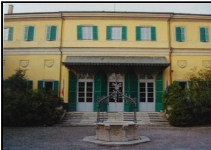
Liceo Statale "Carlo Porta" sede in villa Amalia